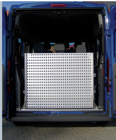
Fahrzeug mit eingeklappter Rampe. Die Durchsicht nach hinten bleibt erhalten.